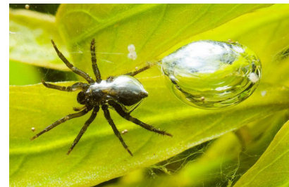
Рис. 3: Паук-серебрянка с воздушным пузырьком

Ключевое инженерное решение: создание устойчивой воздушной прослойки на гидрофобной текстурированной поверхности. Этот принцип используется при разработке супергидрофобных покрытий и подводных конструкций, не требующих энергозатрат.