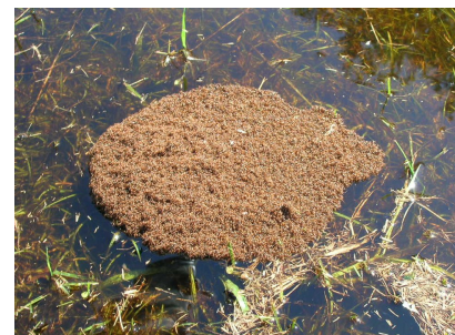
Рис. 4: Огненные муравьи, образующие плот