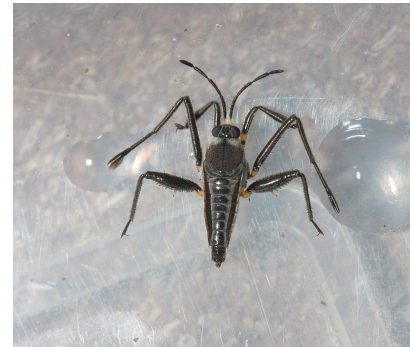
Рис. 2: Раговелия — водомерка с вёслами

Ключевое инженерное решение: использование подвижных элементов, меняющих свою геометрию при взаимодействии с водой, что позволяет сочетать устойчивость с эффективностью движения.