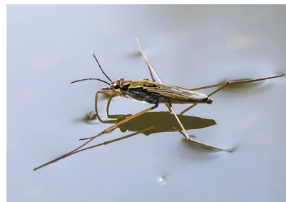
Рис. 1: Водомерка на поверхности воды

Ключевое инженерное решение: максимальное удлинение линии контакта с водой при минимальной массе и обеспечение гидрофобности всех контактирующих элементов.